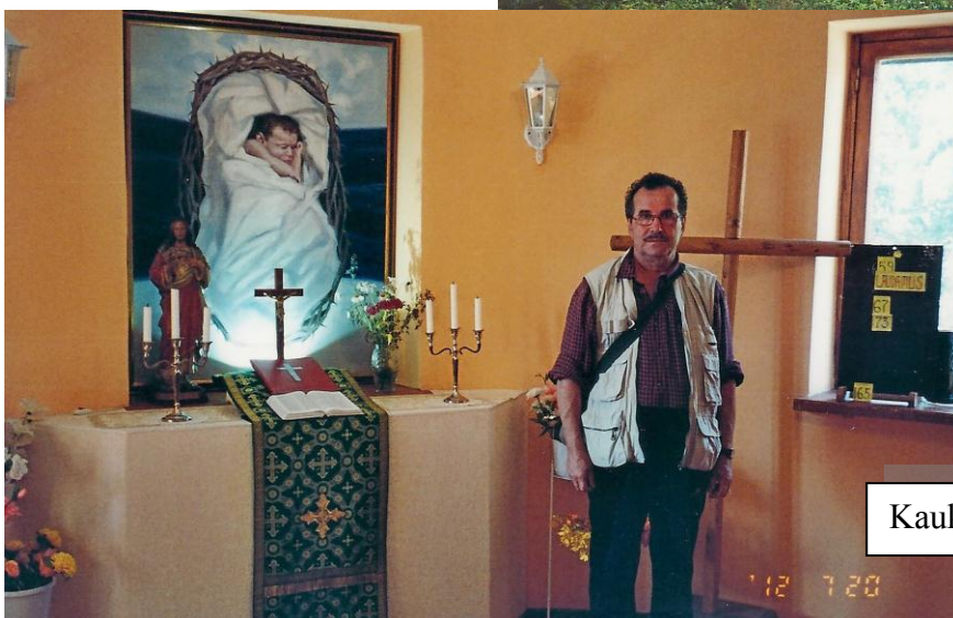
Kaukolan kirkon sakasti remontin jälkeen