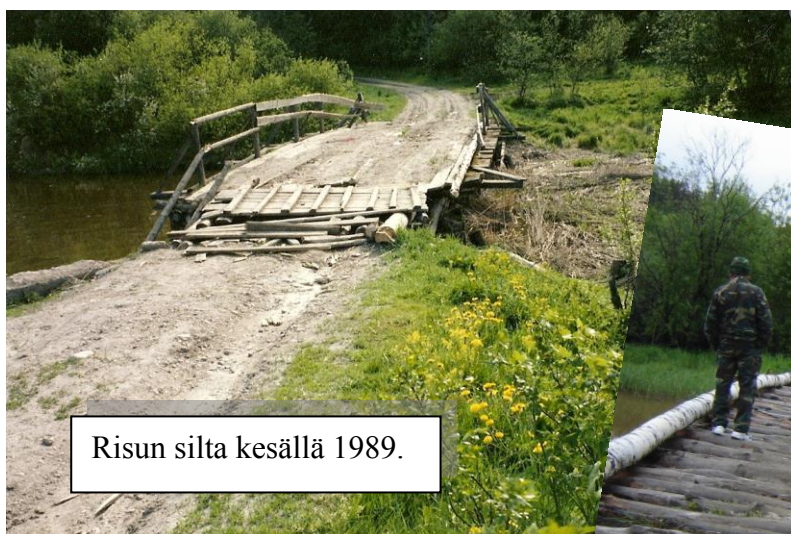
Risun silta kesällä 1989.