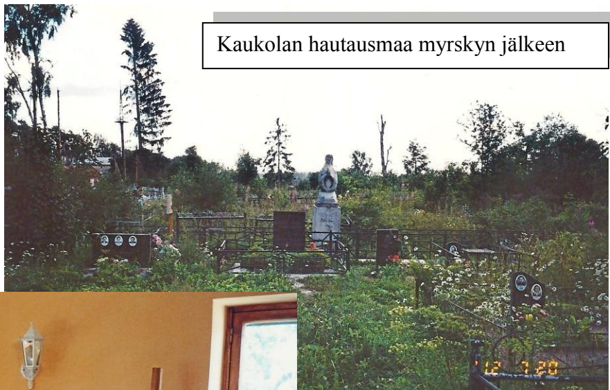
Kaukolan hautausmaa myrskyn jälkeen