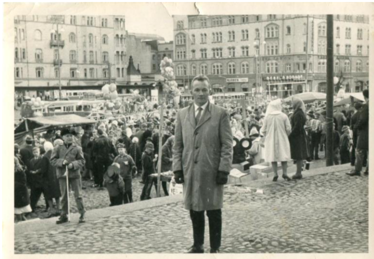
Kuva 3. Nuori mies isossa kaupungissa.