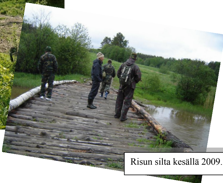
Risun silta kesällä 2009.