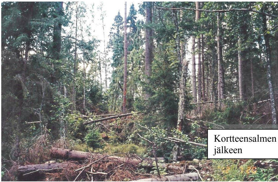
Kortteensalmen maisemia myrskyn jälkeen