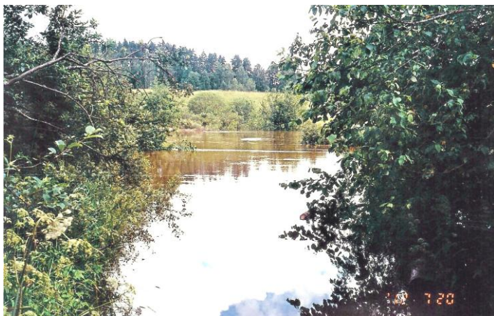
Risun silta heinäkuussa 2012. Sitä ei ole purettu pois, vaan se on kokonaan veden alla.