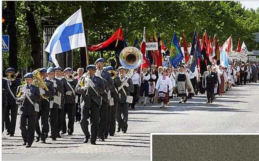
KARJALAISET KESÄJUHLAT OULUSSA 15. - 17.6.2007