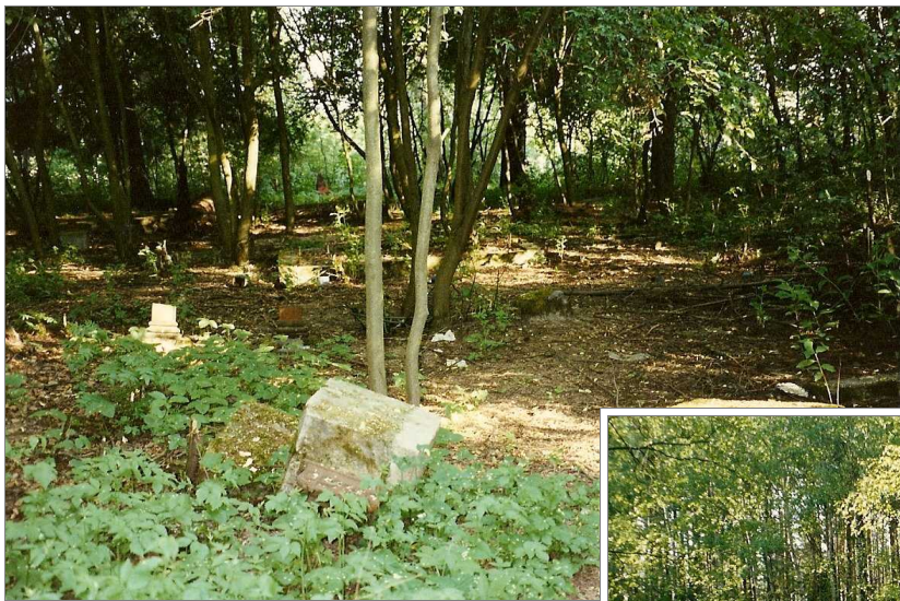
Kaukolan hautausmaata 1989.