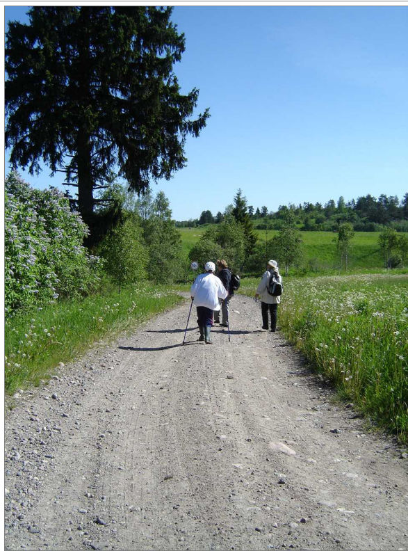
KOTISEUTUMATKALLA KAUKOLASSA 7. - 10.6.2007