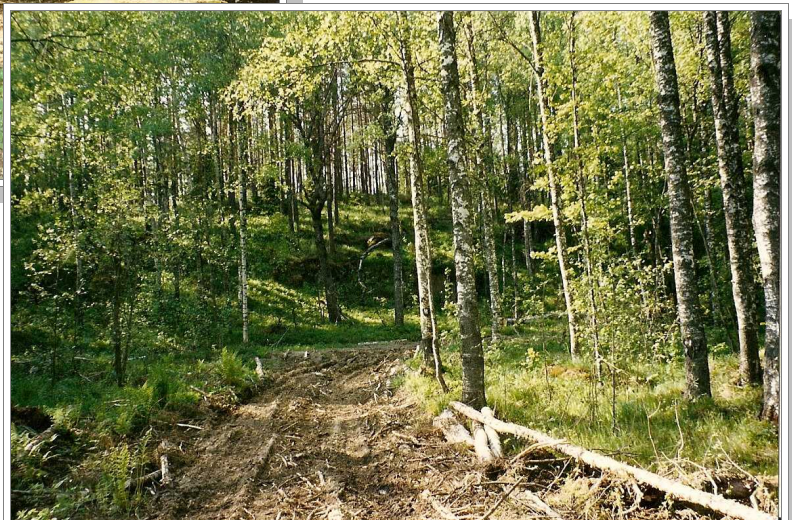
Tienhaara Pata-aholle 1989.