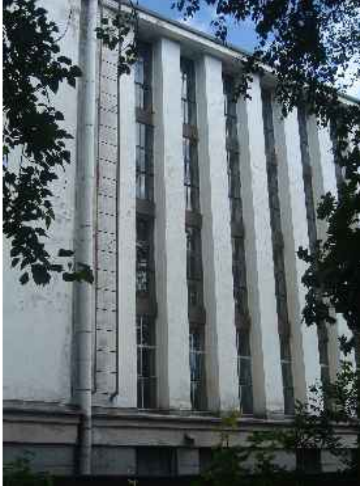
Valokuvia kesällä 2006 Viipurista Oblastinarkistosta.